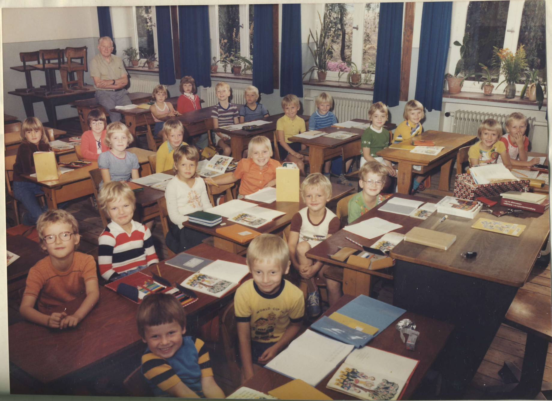
1. skolegården 1976/77 28 kinder