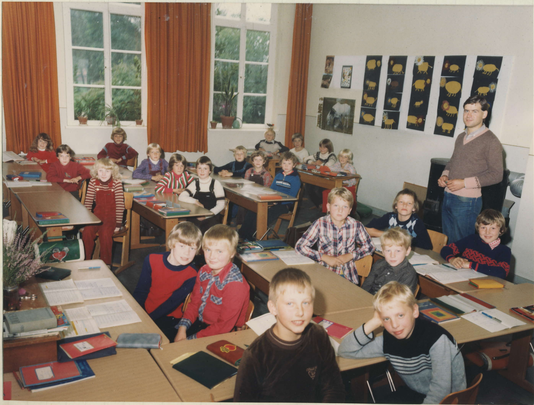
Klassenslechts: Herr Bummel