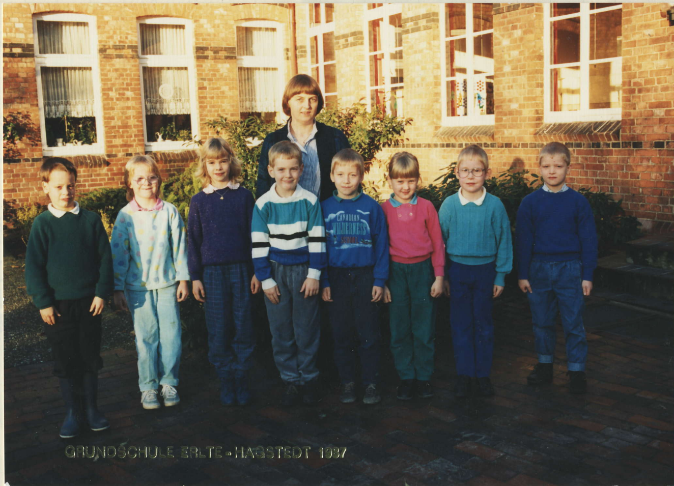
GRUNDSCHULE ERLTE - HAGSTEDT 1987