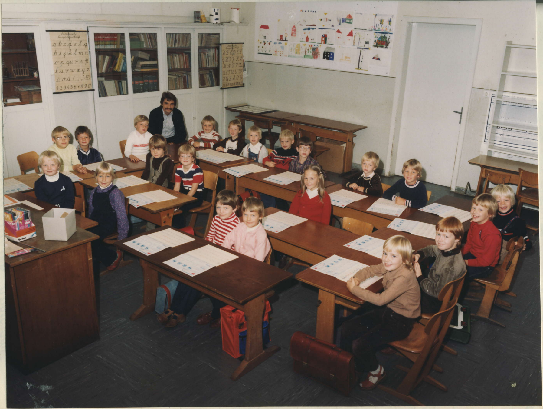
Schulj: 1980/81 21 Kinder