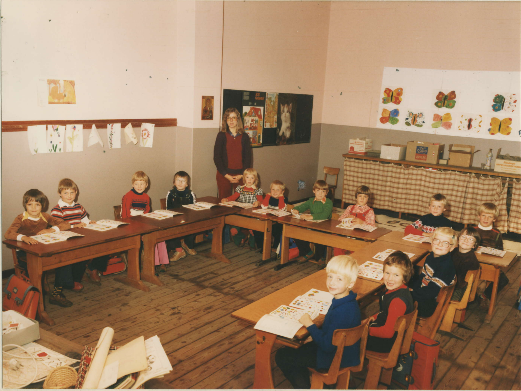
1. Schuljahr 1979/180 14 Kinder