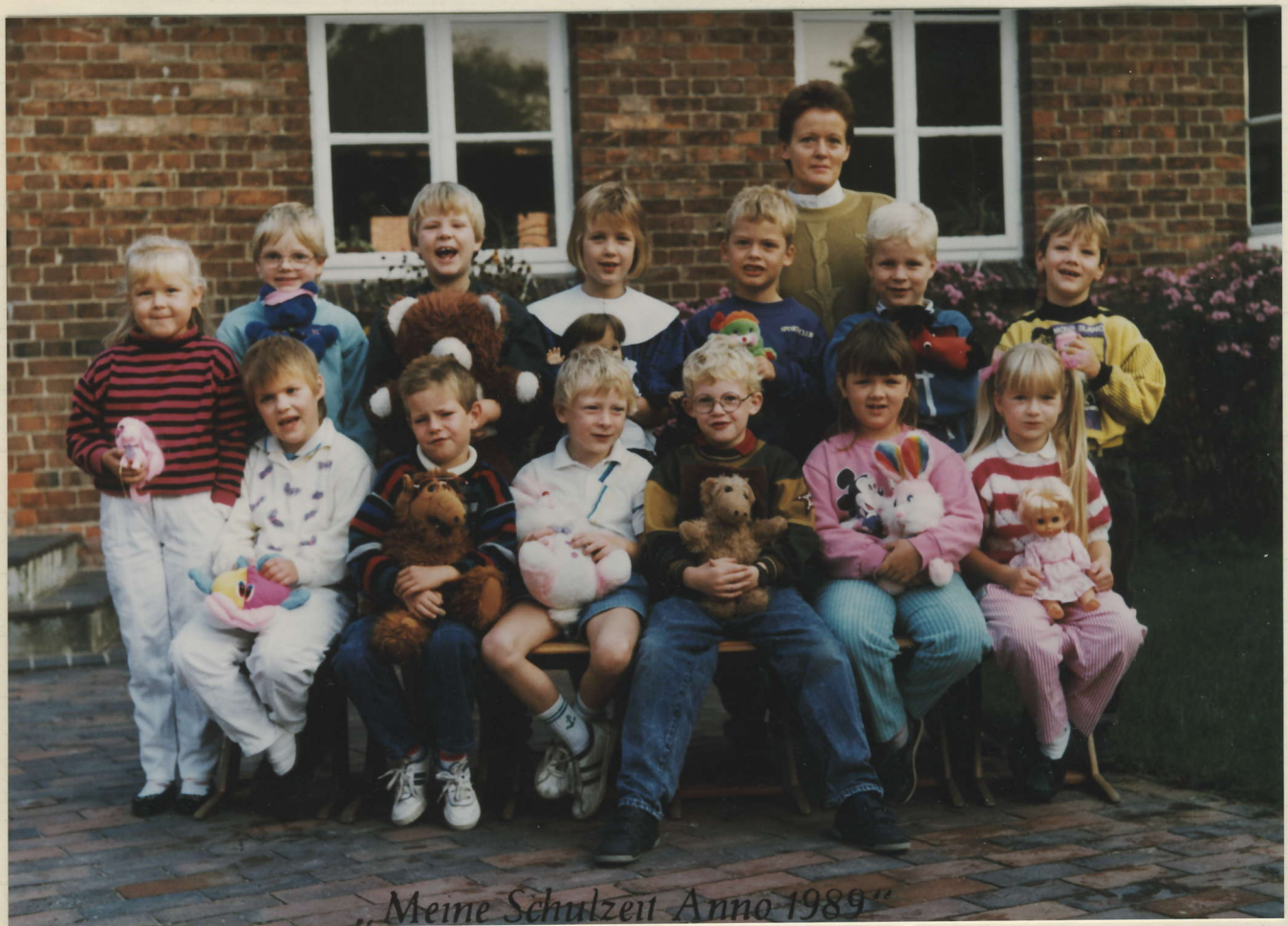
„Meine Schulzeit Anno 1989“